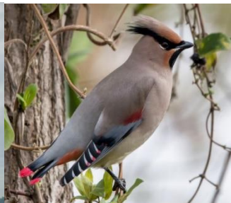
ヒレンジャク(緋連雀、十二紅、 学名: Bombycilla japonica)は、

北東アジアに生息するレンジャク科に分類される鳥である。日本では冬鳥として見られる。Wikipedia より、写真は eBird サイトから