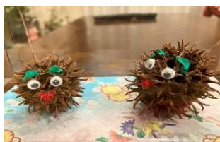
眉・目・口を付けて変身