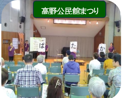
高野公民館まつり