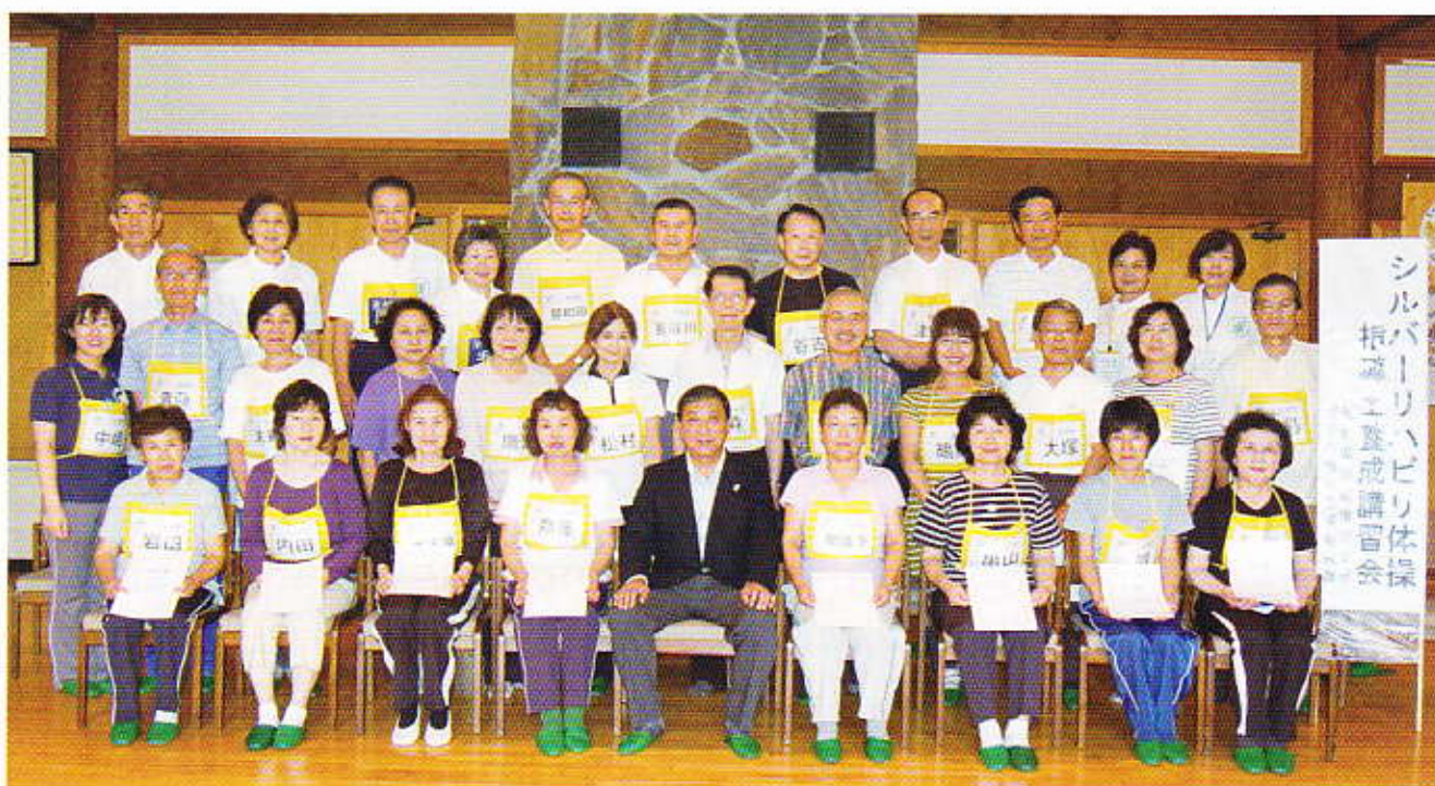
2009年7月24日 3級60コース生誕生（守谷市）