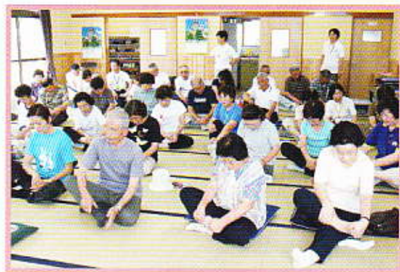
足の指体操 曲げてそらせて！山ゆり会(土塔新山公民館)