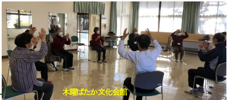
木曜またか文化会館