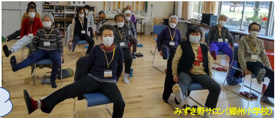
みずき野サロン(郷州小学校)