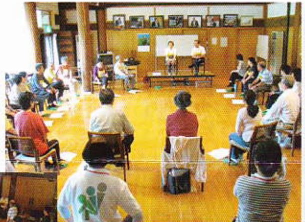
◀ ▲98コース 3級指導士養成講習会